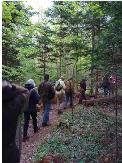
Quelques oiseaux que nous avons entendu au Parc des Pionniers -soirée 26-mai evening- A few of the Birds we heard at Pioneer Park